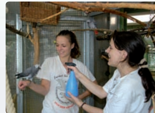
Professionelle Pflege erhält unsere Schützlinge gesund und zufrieden.