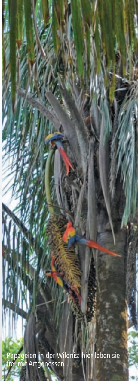
Papageien in der Wildnis: hier leben sie frei mit Artgenossen ...

Die Arbeitsgemeinschaft Papageienschutz ist ein gemeinnütziger, nicht gewinnorientierter Verein, der sich für den Schutz von Papageien in freier Wildbahn und für die Verbesserung deren Haltung in Menschenobhut einsetzt. Der spezialisierte Verein wurde 1996 von der Wiener