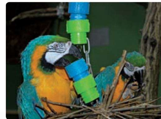
Spielzeuge und Kletterstrukturen sorgen für Abwechslung und Beschäftigung.