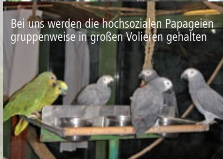
Bei uns werden die hochsozialen Papageien gruppenweise in großen Volieren gehalten

Zoologin Nadja Ziegler gegründet. Im Jahr 2010 wurde die ARGE Papageienschutz mit dem österreichischen Bundestierschutzpreis ausgezeichnet.