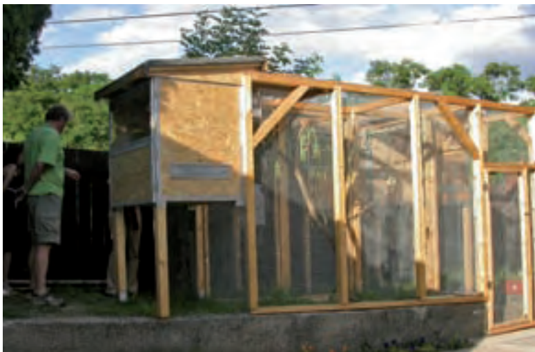
Für Sommer-Gartenvolieren sind kleinere, nicht isolierte Schutzräume ausreichend.

frontiert und erleben natürliche Temperaturschwankungen, vor allem jene zwischen Tag und Nacht. Der Aufenthalt im Freien bringt stumpfes Gefieder wieder zum Leuchten, die Vögel werden fitter, die Verschmutzung der Wohnung fällt weg, etc. Die vielen Vorteile einer Gartenvoliere wiegen die wenigen Nachteile bei weitem auf, so etwa die Gefahr der Übertragung von Krankheiten durch Wildvögel (sehr selten!).