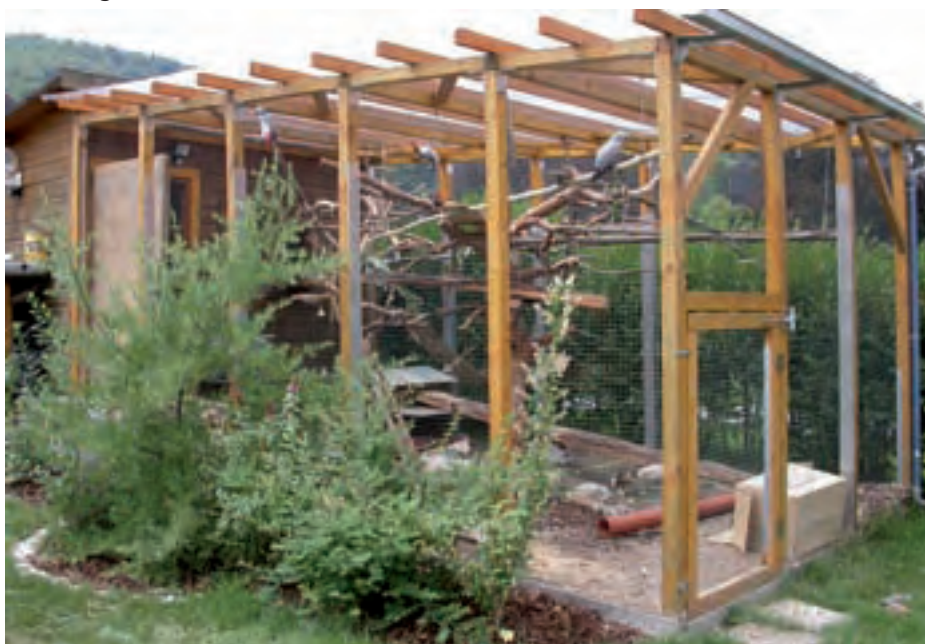
Grüne Sträucher und Kletterpflanzen erfreuen Mensch und Tier, spenden Schatten und versorgen mit frischen Blättern und saftigen Beeren.