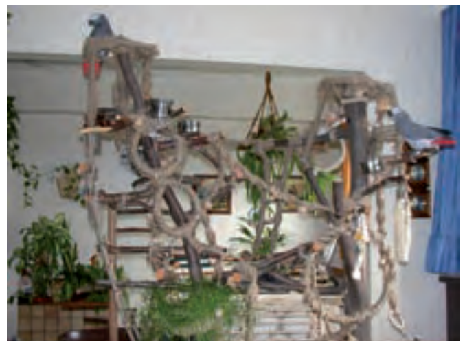
Über einen kreativ gestalteten Kletterbaum freut sich jeder Vogel.

Nehmen wir den seltenen Fall an, dass „immer“ wirklich immer ist. Was bedeutet das in der Praxis?