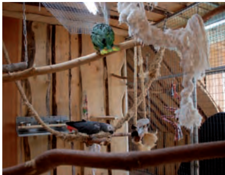
Ungehobelte Bretter als Wandverkleidung bringen Beschäftigung für die Papageien und können leicht ersetzt werden.

Rahmen: Hierfür stehen drei Materialien zur Verfügung: Holz, Aluminium und Stahl. In dieser Aufzählrichtung verläuft auch die Stabilität und Haltbarkeit. Holz wird am schnellsten renovierungsbedürftig sein, es wird angenagt, im Freien ist es der Witterung ausgesetzt und wenn einmal eine ansteckende Krankheit auftritt, ist es praktisch nicht zu desinfizieren. Doch Holz hat auch viele Vorteile: es ist günstig und leicht zu bearbeiten. Spezialkonstruktionen sind ohne größeren Aufwand machbar. Nicht zuletzt sieht es natürlich und freundlich aus. Bei starken Nager, wie Graupapageien, ist es nicht zu empfehlen, außer man schützt die Holzrahmen innen mit Aluminiumwinkeln.