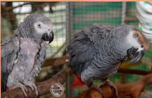
Graupapageien Valentina und Rocko