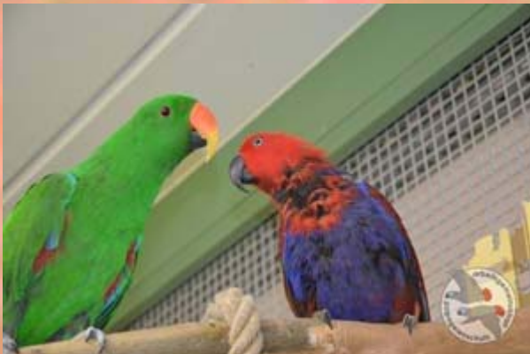
Edelpapagei Amy (rechts) mit ihrem neu gewonnenen Freund Woody .